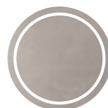
Gres Sugar Glocal gc 07 sp